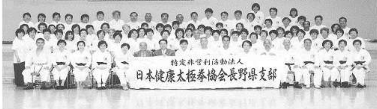
キッセイ文化ホールにて