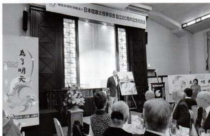
学士会館210号室にて

平成11年(1999年)6月11日に特定非営利活動法人日本健康太極拳協会は、設立して、今年20周年を迎えました。