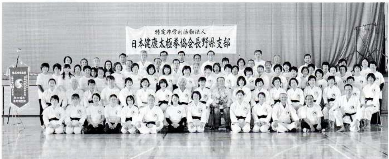
下諏訪体育館にて