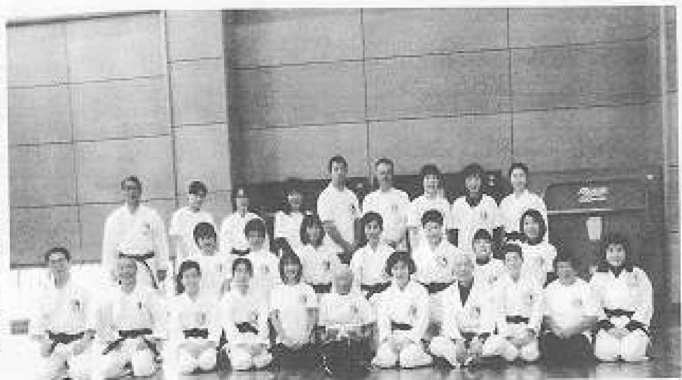
長野県支部の参加者