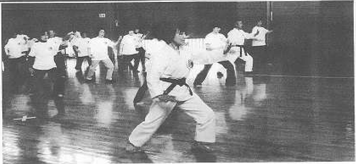
甲府市総合市民会館にて

楚な姿と重なり、私の緊張感もほぐれて行く 思いでした。その後皆で二十四式を舞い、先 生から細かい所の御指導を頂き、各々に留 めながら明日からのお稽古に、生かして行こ うと誓った事でしょう。