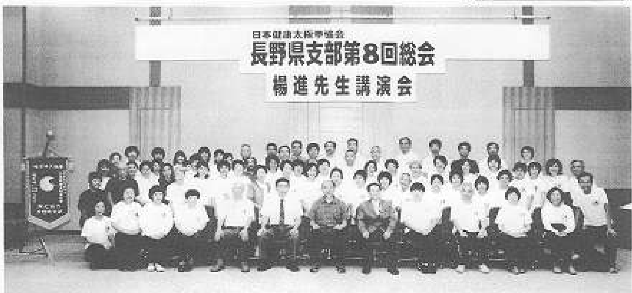
キッセイ文化館ホールにて

考えて動くことは、例えば、目の動きについて、楊名時太極拳種古要路の一つに「眼隨手転」とあります。目は、次の動きの方向を定めます。目の動きが身体の方向を定めるのに、「目が手の動きを追う。」という理由は、目は身体の中で最も速く反応する