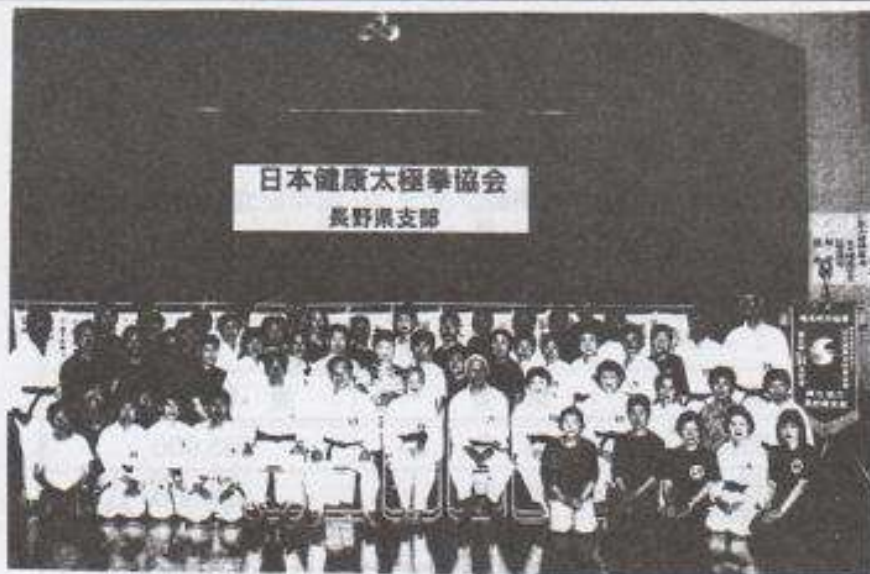
長野県支部総会・講習会 (安曇野市三郷にて)