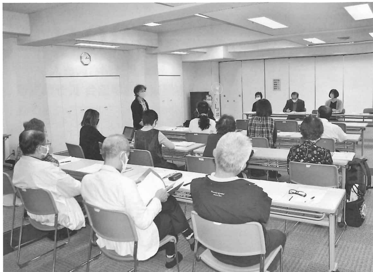
長野県支部総会(トライあい・松本にて)

今回の総会は、何もかもが初めてで戸惑うこともありましたが、役員理事の皆様、教室担当の先生方をはじめ支部会員の皆様にはご理解とご協力をいただき心より感謝いたします。