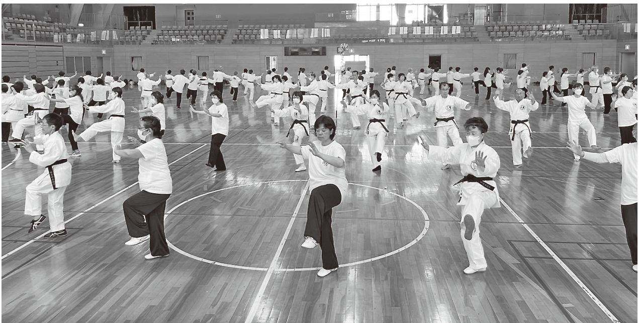
参加者全員での百花拳演舞