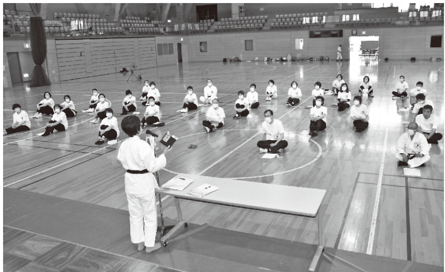
栗林師範の話を熱心に聴講

最後になりましたが、支部長をはじめ運営にご尽力いただきました先生方には、心より感謝申し上げます。