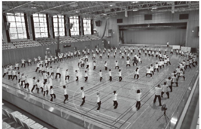
全員で百花拳を演舞